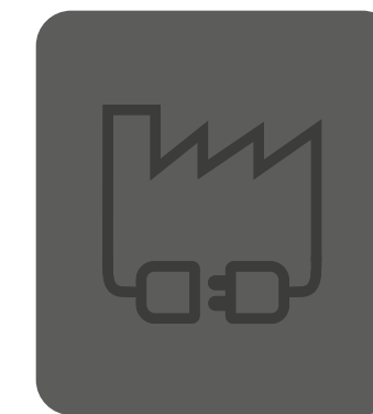
MATERIALE ELETTRICO INDUSTRIALE