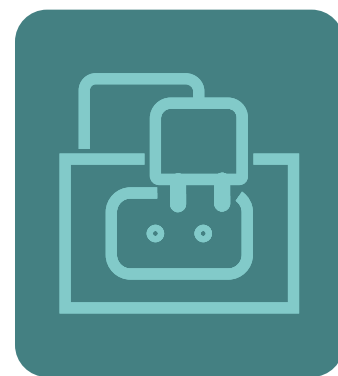
INSTALLAZIONE CIVILE DA PARETE E INCASSO