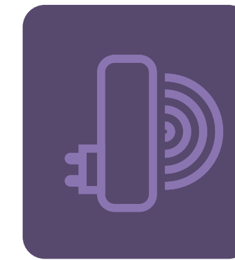
DISPOSITIVI COMANDO E CONTROLLO