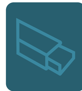
SISTEMI DI CANALIZZAZIONE