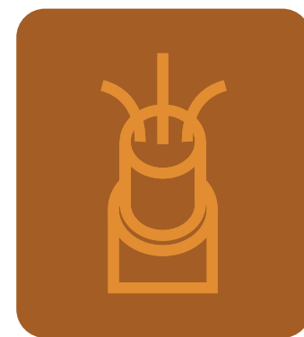
CAVI E ACCESSORI