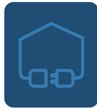
MATERIALE ELETTRICO CIVILE

L'azienda produce e distribuisce materiale per uso domestico e industriale: spine, prese, adattatori, multiprese e prolunghe, cavi e accessori per installazioni e canalizzazioni, sistemi di illuminazione e dispositivi di comando e controllo smart.